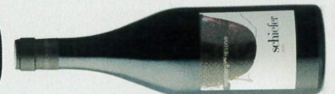
17,4 schiefer.pur ★★★★ 2015 Reihburg Reserve