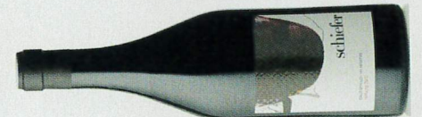
17,5 schiefer.pur ★★★★★ 2015 Reserve EB-R